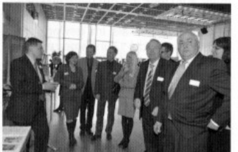
Der Stand der AG Unternehmensnachfolge beim "AKW-Tag der Geschäfte" im März 2010 in der Congresshalle Saarbrücken